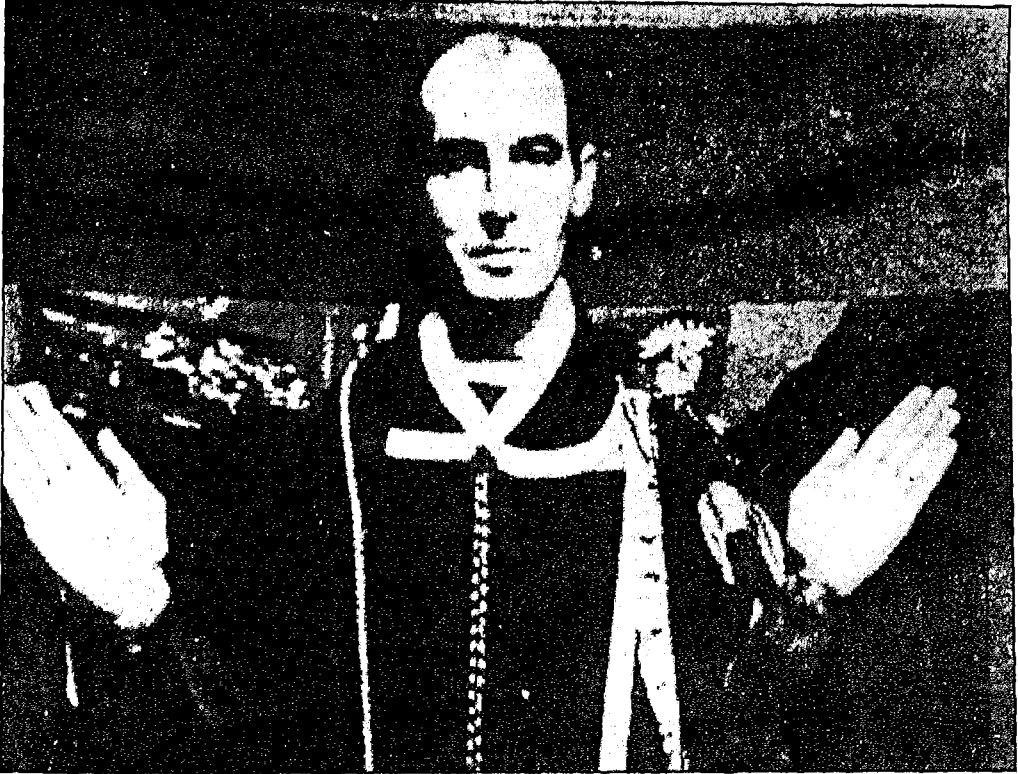
كاهن الشيطان فى أمريكا ..